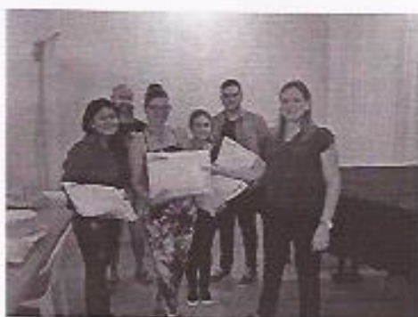
ENTREGA DE OBSEQUIOS A ALGUNOS PROYECTISTAS.