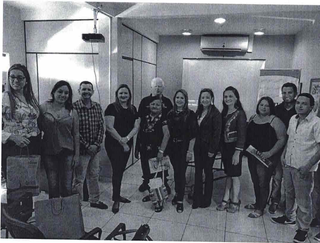
Foto: Grupal de algunos de los asistentes.-